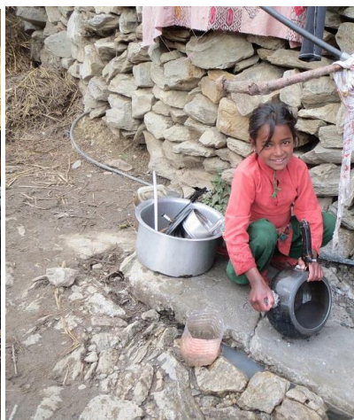
Flicka diskar vid väggkant i Simikot