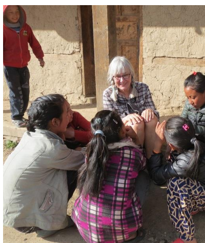
Flickorna flockades kring Elisabet 2019

Clearingnummer 8327-9 och kontonummer 904 500 6518.