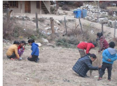
vårda våra nya plantor.

Allt detta har kunnat och kan ske tack vare Ert stöd till vår verksamhet. Vi tackar alla privatpersoner, föreningar, stiftelser och företag som på olika sätt stödjer oss. Här vill vi framhålla Familjen Olofsson Stiftelse och reseindustrins Stiftelse New Hope.