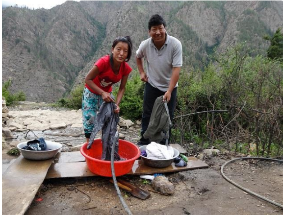
Så här fick skolhemmet allt sitt vatten 2014.

Det planeras även för två nya toaletter och någon typ av duschrum. Hittills har all hygien skötts utomhus vid våra vattenkranar. Ledningen till den nya vattenkällan är klar så nu har vi inga problem med mängden vatten längre.