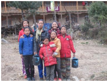
Här är några barn på väg att

Hygienfrågan vid skolhemmet har successivt förbättrats och är på väg att förbättras ytterligare. Vidare ser vi vårt trädplanteringsprojekt som en möjlighet att åtminstone på sikt, tillsammans med vårt växthus, ytterligare bredda försörjningsbasen på skolhemmet.