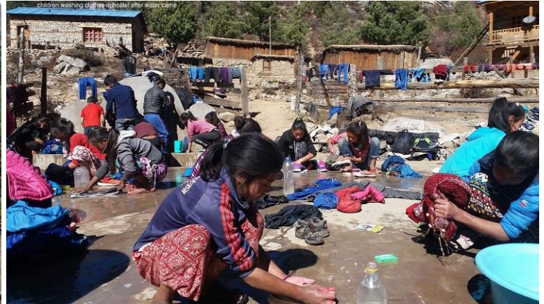
Nu finns det vattenkranar, fri tillgång till vatten och en stor yta för tvätt av kläder. Snart kanske det även finns ett duschrum att tvätta sig i också.