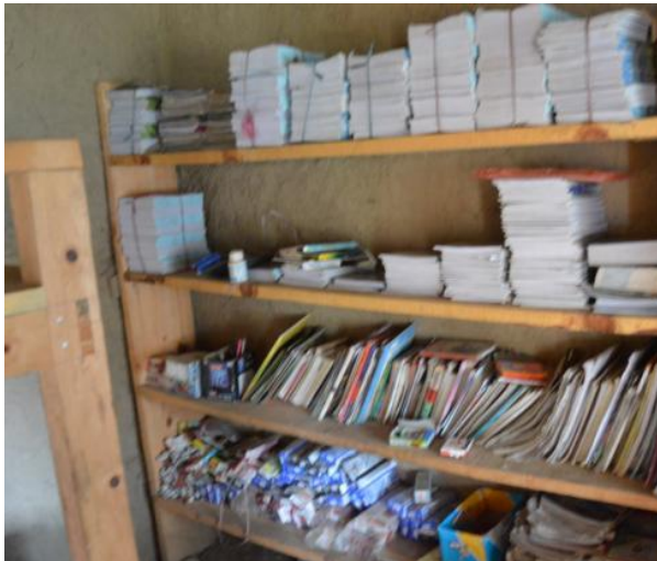
Ett litet lager av skolmaterial. Det går åt mycket till 50 barn.