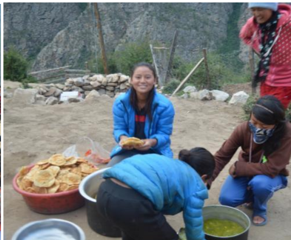
De större barnen fungerar som serveringspersonal.