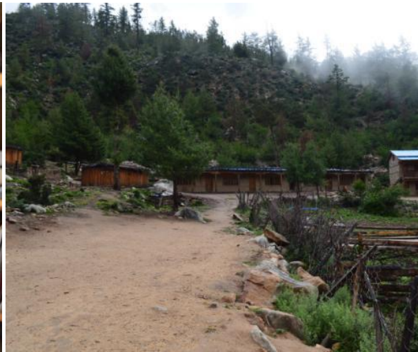
Vy över skolhemmet med en av våra köksträdgårdar i förgrunden.

I år har vi återigen fått stöd för inköp av undervisningsmaterial. Vi har även fått bidrag till bl.a. inköp av fröer till vårt växthus och våra köksträdgårdar samt för att komplettera tidigare planteringar av äppelträd och även för att utöka med nya planteringar. Eftersom det inte finns någon mat för avsalu i Humla är det ekonomisk och ur hälsosynpunkt viktigt att vi kan berika barnens kost med grönsaker och frukt från egna odlingar. Att sköta dessa ger dessutom barnen en praktisk kunskap.