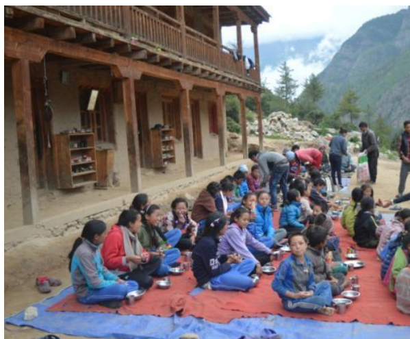
Ibland intar man måltiden i det fria.