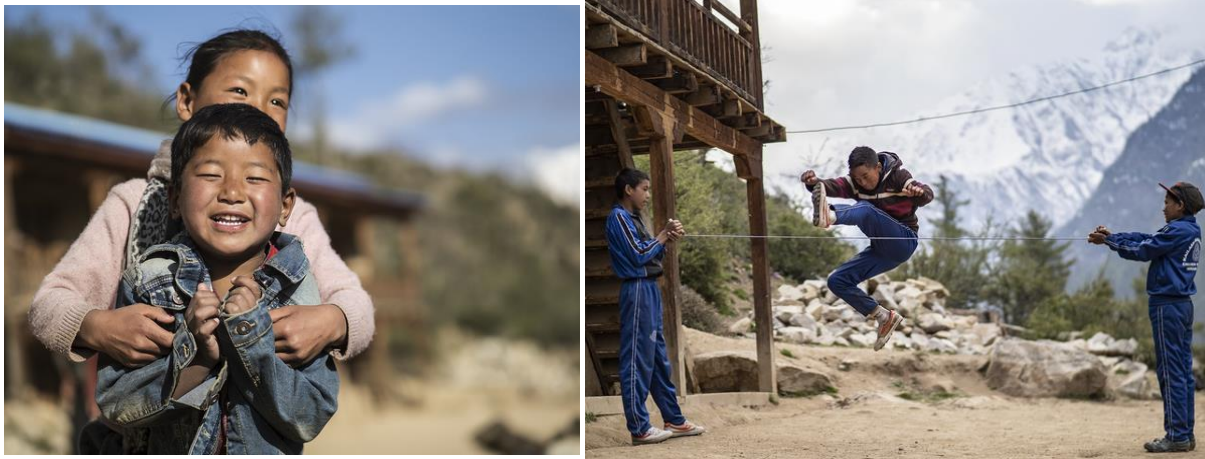
Lekande barn på skolhemmet

Och succén fortsätter. Nu bedrivs undervisning även i klass 11 för vissa linjer och nästa år även i klass 12. Inte nog med det, nu kommer det även att bli en jordbruksutbildning, som vi yrkat på sedan vårt första möte med skolledningen. I mars 2020 startar en jordbruksutbildning för klasserna 9 till 12. För detta har anställts två nya lärare. Även praktik kommer att ingå. Lärarna i engelska har nu högre utbildning än tidigare varför vi förväntar oss att barnen kommer att bli bättre i engelska.