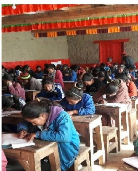
Studieflit både inne

Under året bodde 47 barn på skolhemmet, 27 flickor och 20 pojkar. Antalet barn är störst i klasserna 5 till 8. I dessa klasser går 30 av de 47 barnen. I Nepal är man mycket för att gradera och betygsätta. Barnen från KMCH har ofta mycket framskjutna placeringar i sina respektive klasser. Att många av våra barn är duktiga att dansa och spela det har vi noterat de gånger vi har besökt skolhemmet. De har ofta ombetts att dansa vid festivaler på klostret.