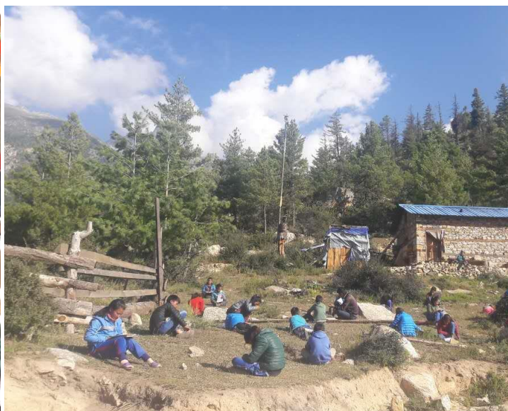
och ute ger resultat.

Nu är det så att inte bara barnen från KMCH är duktiga i sång och dans. I september utsåg utbildningsdepartementet i Nepal våra barns skola, Shree Mahaboudha Secondary School, till den bästa "performing community school in remote areas of all Nepal". Som nämnts i föregående nyhetsbrev, blev skolan i höstas även utsedd till en av Nepals bästa kommunala skolor i s.k. "remote areas". Vi hoppas att dessa utmärkelser skall underlätta för skolan att få tillstånd att undervisa även i klasserna 11 och 12 så att våra barn slipper att åka till Kathmandu för att läsa vidare efter klass 10. Vi vet att skolans styrelse arbetar för detta.