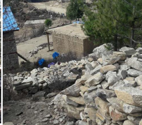
och här ligger en av stenhögarna som skall användas.

Vi har satsat pengar på att utbilda några från KMCH och några bybor i att plantera och sköta fruktträd. Vi har även köpt planteringsutrustning och sticklingar för plantering. Detta är ett projekt som inte bara är begränsat till skolhemmet. Vi räknar med att de