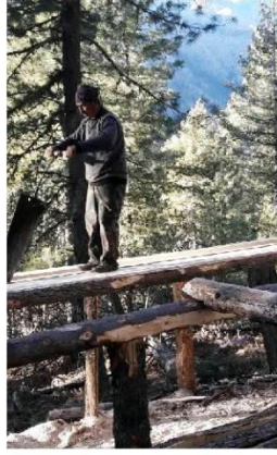
Här sågas stockarna