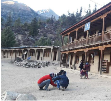
I fonden ses huset som skall få en andra våning.