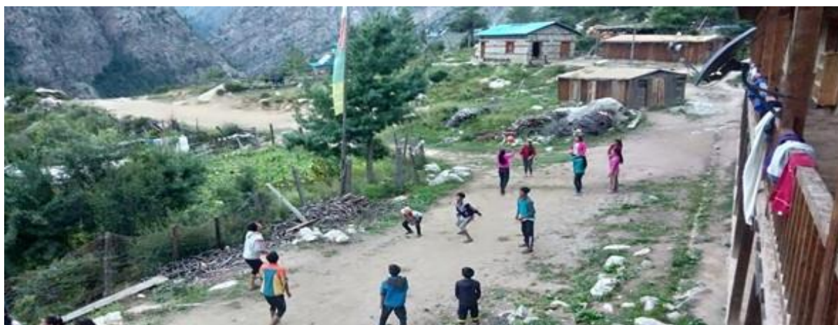
Lek utanför skolhemmet långt från politikernas käbbel

Ett lika stort ämne är Nepal Communist Party och hur de agerat i parlamentet sedan september. Partiet har i protest mot talmannen totalt obstruerat det parlamentariska arbetet. Jag har tittat på inspelningar från parlamentet och det är sorgligt att se hur NCP:s ledamöter lämnar sina platser och skanderar slagord och omöjliggör parlamentets arbetsuppgifter. Och detta sker varje gång parlamentet samlas för debatter och diskussioner.