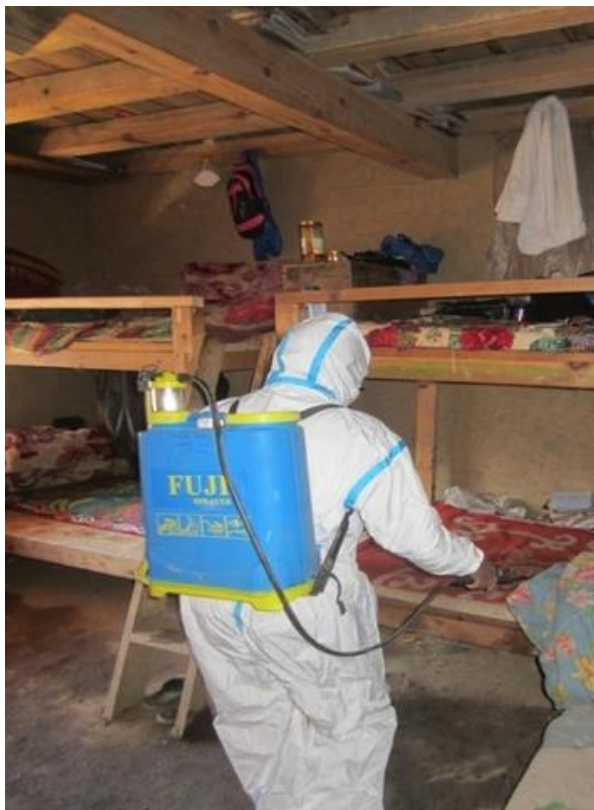
Inte bara munskydd och handsprit utan även annan typ av sanering.