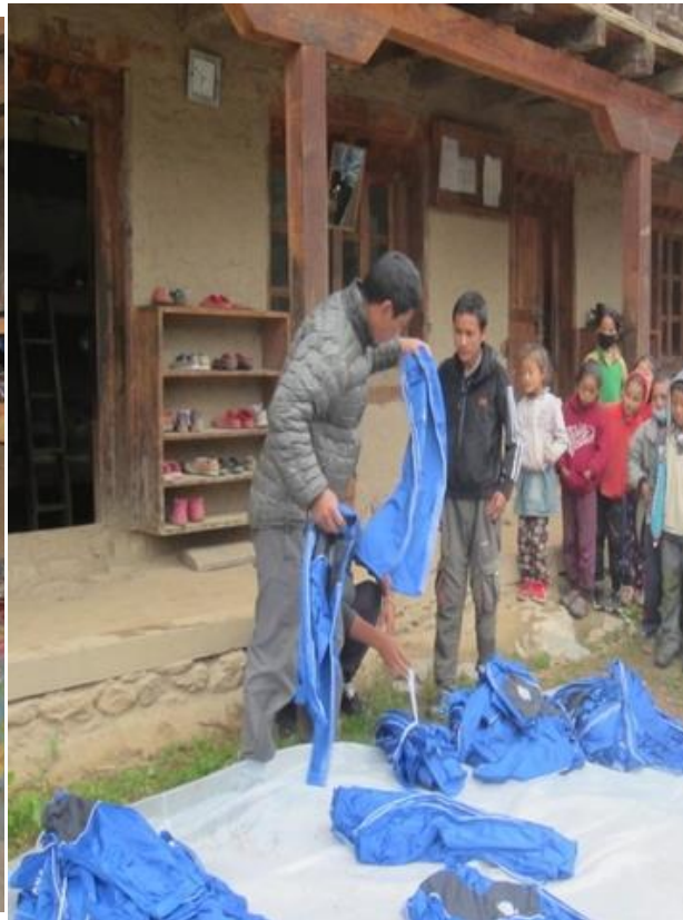
Utdelning av kläder och skor sker regelbundet.