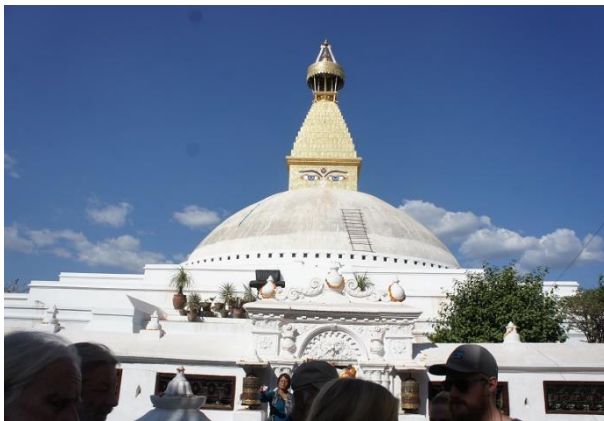
Bodhnathstupan var nästan återställd efter jordbävningen.

Nepal har, menar statsvetaren Deepak Gajurel, på grund av inkomsten från migrantarbetare övergått från en jordbruksdriven ekonomi till en ekonomi driven av hemskickade pengar. Det betyder att inkomsten från pengar skickade från utlandet är av större vikt för snittnepalesen än inkomsten från jordbruket. År 2014 skickades 5.5 miljarder US$ till nepalesiska familjer med släktingar arbetandes utomlands. Samma års motsvarande statsbudget uppgick till 6 miljarder dollar, vilket ger en indikation av betydelsen av dessa pengar. Inkomsterna ger ökad materiell levnadsstandard för migranternas familjer. Ofta kan pengarna räcka för att flytta från landsbygd till stad, vilket innebär att migrantarbetarnas hemskickade pengar bidrar till att driva på urbaniseringsprocessen i Nepal.