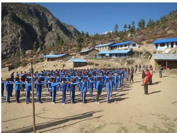
Uppställning på skolgården.

Klockan tio varje morgon, utom lördag, ställer sig 300 barn och ungdomar upp på grusplanen utanför den statliga skolan i Yalbang. Det är en vanlig morgon på Shree Mahaboudha School. I raka led väntar de alla och snart sjunger man tillsammans med lärarna nationalsången. Sedan bär det av, led efter led, från sex-sju åringar upp till sjutton-artonåringar, årskurs efter årkurs vandrar i väg till sina klassrum.