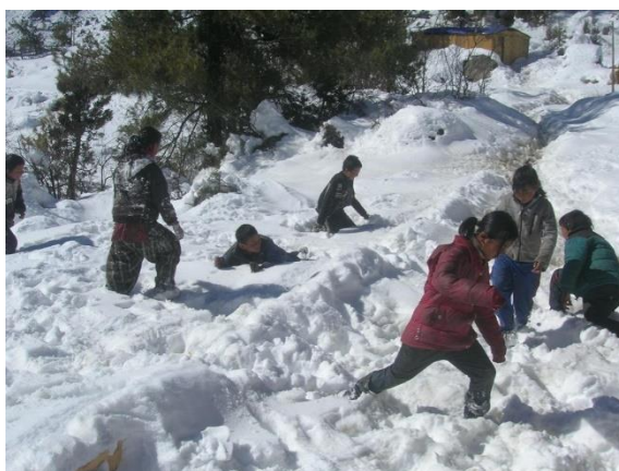
och barn som leker vid skolhemmet.

I vår är det tio år sedan både KMCH Nepal och KMCH Support Group bildades. Dessa tio år har gått fort med mycket arbete både i Nepal och här i Sverige. De två ungdomar som gick ut skolan förra året hade varit med KMCH sedan starten i Kathmandu. Båda studerar nu, som bekant, vidare i Kathmandu och återvänder efter utbildningen förhoppningsvis till Humla. Detta är ett "kretslopp" som vi kan hoppas på inte bara kan komma att gälla för dessa två utan för flera av de ungdomar från KMCH som nu successivt kommer att gå ut klass 10. Allt i förhoppningen om att detta skall bidra till en positiv utveckling i Humla.