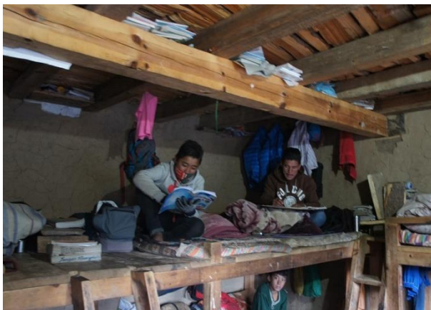
Läxläsning på skolhemmet sker i sovrummen, i lektionssalar

I ett av de äldre gruppernas klassrum arbetade man med matematik. Temat just den här lektionen var ganska komplicerade geometriska beräkningar. Tänk bort tekniken i form av datorer och smartboards; arbetsgången är som i vilket klassrum som helst. Stämningen i klassrummen mellan läraren och eleverna och mellan eleverna verkade vara god, trots ibland stora grupper. Skylten utanför ett av rummen berättar att här inne finns skolans datasal. Skolan har investerat i ett tiotal datorer, men ännu finns ingen uppkoppling mot internet.