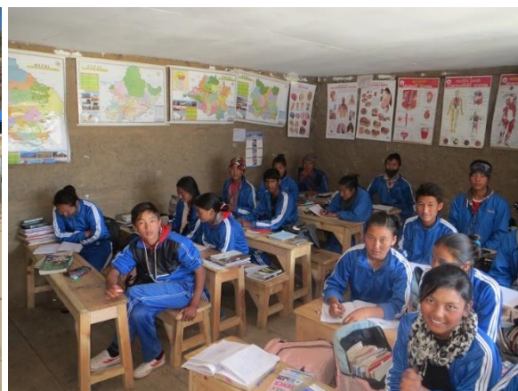
I ett klassrum