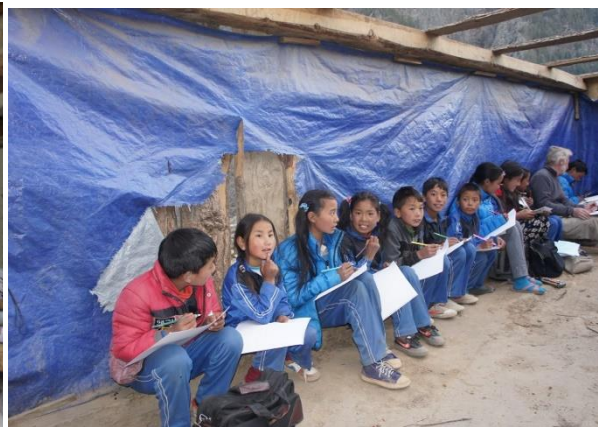
eller utomhus när vädret så medger.

För några år sedan hade vi privilegiet att vara på KMCH:s skolhem i 14 dagar. Vi förstår inte språket, vi förstår inte vad barnen säger till varandra. Men; jag kommer inte ihåg en enda situation där något barn verkade utsatt av mobbning eller trakasserier. Det är omöjligt att inte jämföra med den verklighet jag själv kämpar med varje dag i min skola. Den här gången är vi på skolhemmet bara under 4 dagar. Vi möter glada barn, vi möter lugna barn. Vi möter barn som förstår varför de går till en skola varje dag. För så är det för ungdomar i Nepal. Att gå i skola ger möjlighet att ta sig ut ur fattigdom och otrygg framtid. Och det gäller inte minst i isolerade områden som Humla. I många byar finns det nu visserligen skolor, men ofta bara upp till klass 5. Och för ett land som Nepal är den kanske viktigaste framgångsfaktorn att få tioåriga flickor att fortsätta sin skolgång. Flickorna på Shree Mahaboudha School och