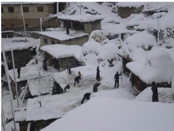
Båda dessa bilder är från tidigare år. De visar byn Yangar