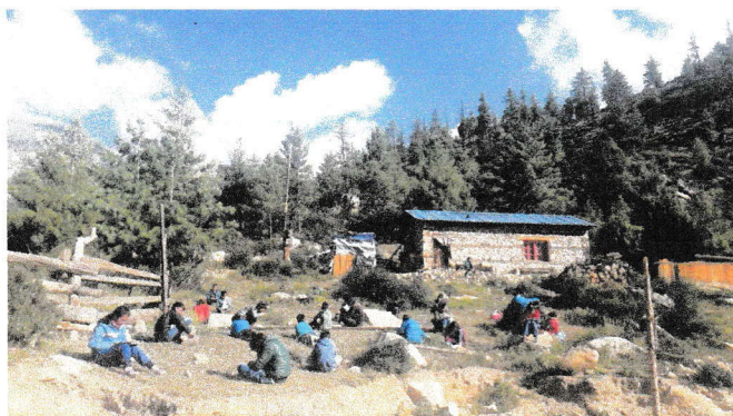
Läsläsning utomhus föredras när så är möjligt

Av årets utgående balans på 700 242 (372 824) kronor utgör 300 kronor förutbetalda medlemsavgifter och 13 700 kronor studiebidrag till våra studenter i Kathmandu. Det egna kapitalet uppgår således till 686 242 (365 224) kronor. Av detta är 277 000 kronor givna med förbehållet att användas till vissa investeringar och 92 000 kronor till av givarna angivna särskilda driftskostnader. Resterande del av det egna kapitalet - 317 242 kronor - kan styrelsen fördela fritt mellan driftskostnader och investeringar.