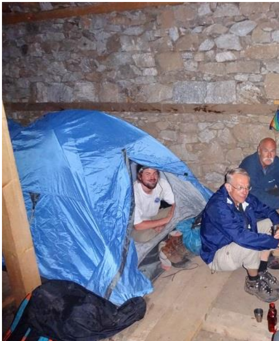
Taket på det nya huset läckte i somras så vi fick tälta även inomhus

Vårt första besök gjorde vi alldeles efter starten i juli 2007. Då låg skolhemmet i Kathmandu. Där bodde då tolv barn från Humla. 2010 flyttade KMCH till byn Yangar i Humla. Oroligheterna i landet hade då upphört och skolan i byn Yalwang var åter igång. Vårt nästa besök var i juli 2011. Då hyrde KMCH fortfarande lokaler i byn. Antalet barn var 33 stycken. Vi slog upp våra tält på en plats ovanför byn där KMCH hade fått mark av byrådet för att bygga ett skolhem. Där planterade vi träd med barnen och släpade stenar inför den kommande byggnationen.