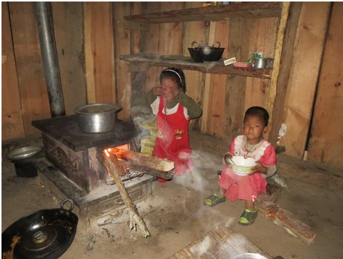
Kökspis i Humla