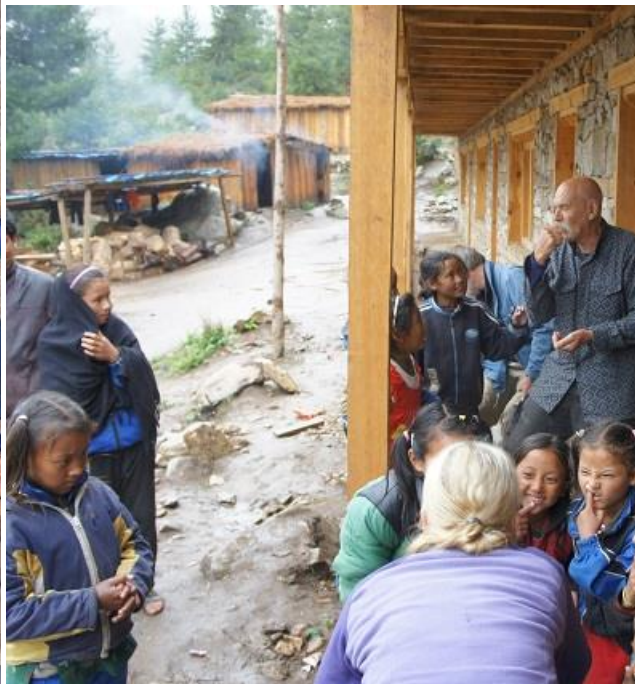
Barnen var ofta hos oss och "pratade" och lekte.

Det tredje besöket var i somras. I de senaste nyhetsbrevens har ni kunnat läsa om hur det nu ser ut med två stora hus med sovrum, undervisningsrum, lager och kontor. Där bor nu 47 barn, våra två lärare, vår platschef med familj och vår lager- och transportansvarige. Vid alla besök har vi slagits av barnens frimodighet, glädje och samarbetsförmåga. Alla möten har varit mycket rörande.